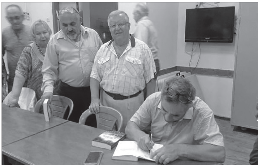
Израиль, Ашдод, 2017 год. После презентации второй книги «Молитва о Михалине» за ней выстраивались в очередь .