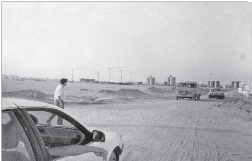
Лето 1991 года. Вдали первые дома будущего жилого района «Юд-гимаель». Ашдод.