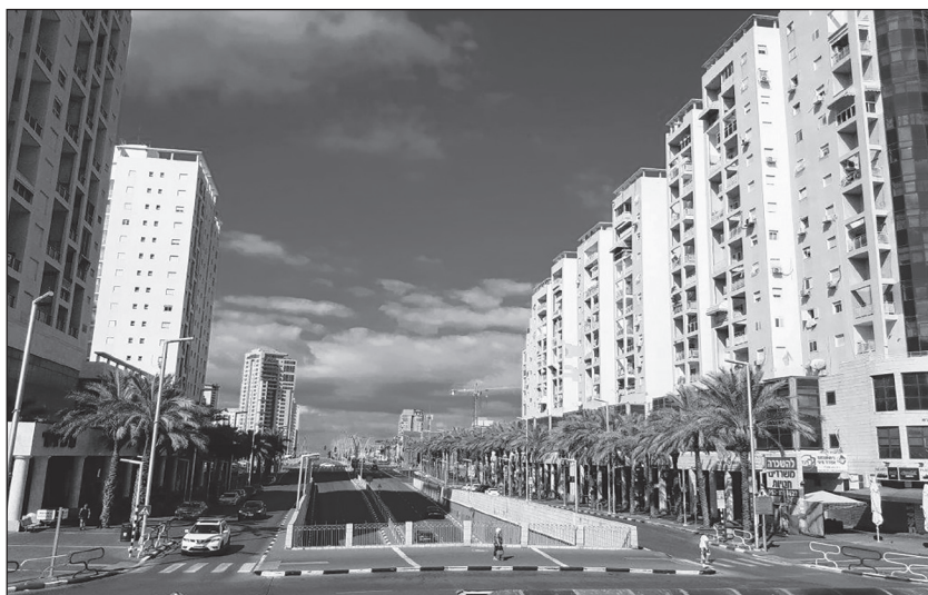
Лето 2018 года. На месте желтых песков – новые кварталы Ашдода, в которых живут репатрианты.