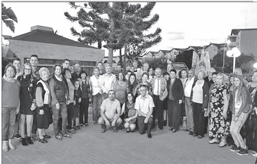
Израиль, Ашдод, 2015 год. На презентацию первой книги «От Михалина до Иерусалима» приезжали со всей страны.