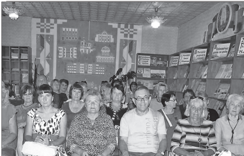
Беларусь, Климовичи. Самые дорогие мои читатели. Мы долгие годы знаем друг друга.